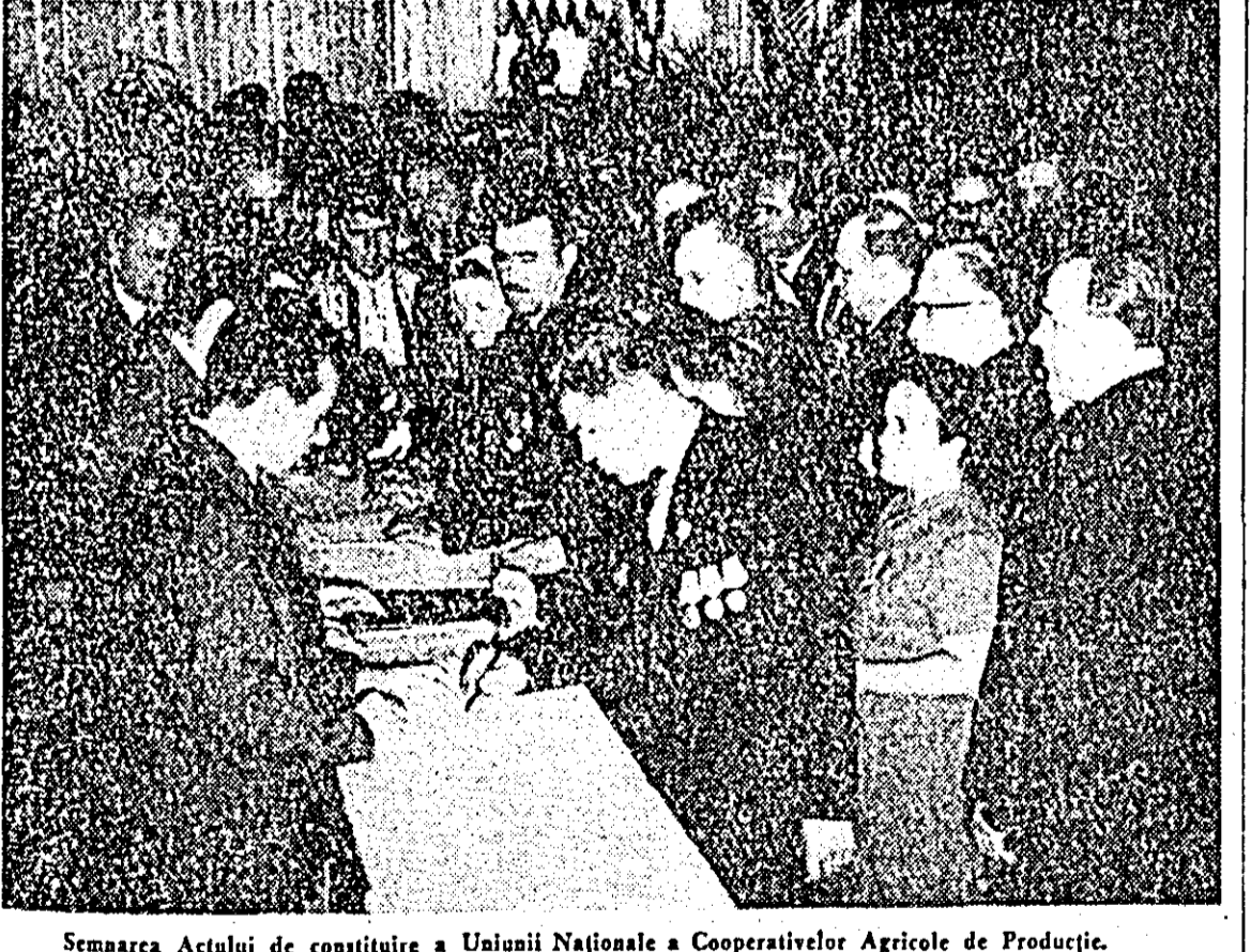
Semnarea Actului de constituire a Uniunii Naționale a Cooperativelor Agricole de Producție.