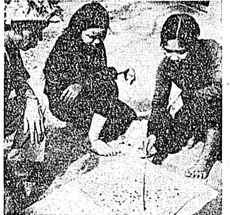
R.D. VIETNAM. — În foto: locuitori discută planul de apărare a satului Bui, provincia Nam Ha.

CIUDAD DE GUATEMALA 9 (Agerpres). — Mendez Montenegro, singurul candidat civil în alegerile prezidențiale din Guatemala care au avut loc duminică, 6 martie, are un serios avans asupra celorlalți doi candidați militari, colonelii Dios Aguilar și Angel Ponciano. Potrivit ultimelor rezultate parțiale comunicate de Tribunalul electoral din Guatemala, provenite din 218 centre de votare (din totalul de 324), candidatul Partidului revoluționar din Guatemala, Julio Cesar Mendez Montenegro, a obținut 138.437 de voturi față de 103.871 care revin colonelului Aguilar și 93.205 colonelului Ponciano. Potrivit rezultatelor anunțate de Tribunalul electoral este puțin probabil ca Mendez Montenegro să obțină majoritatea absolută care să-i permită să fie ales direct președinte al țării. Candidatul Partidului revoluționar din Guatemala reunește pînă în prezent 43 la sută din sufragii, iar pentru a fi desemnat președinte îi trebuie jumătate plus unu din voturi. În cazul cînd nici unul din candidați nu intrumeste majoritatea absolută, viitorul șef al statului ar urma să fie ales de noua Adunare Națională a țărilor dintre primii doi candidați care au intrunit cel mai mare număr de voturi. Întîrzierea anunțării rezultatelor alegerilor din provincie ca și acuzațiile liderilor Partidului revoluționar din Guatemala în legătură cu falsificarea voturilor în circumscripțiile electorale din provincie par să indice faptul că actuala luptă militară din Guatemala nu dorește victoria unui candidat civil.