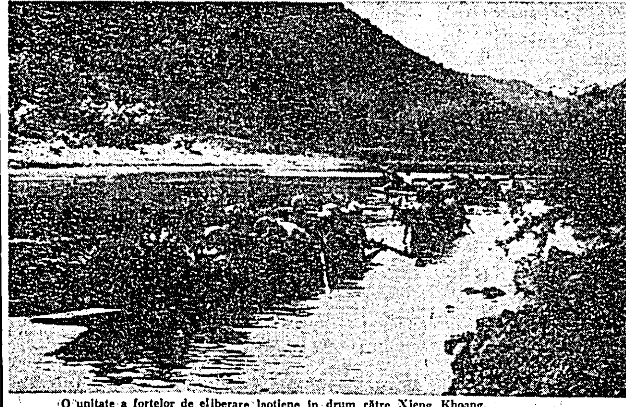
O unitate a forțelor de eliberare laotiene în drum către Xieng Khouang.