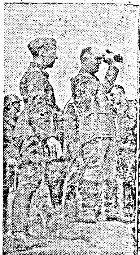
D. G-ral ION ANTONESCU, priv. câmpul de luptă.

În stare disperată cei doi îndrăgostiți au fost transportați la Spitalul „Căpitan Patronele.”