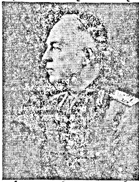
D. General ION ANTONESCU Conducătorul Statului Român.

După scurt timp generalul Antonescu pleacă. Dar noi rămânem să observăm