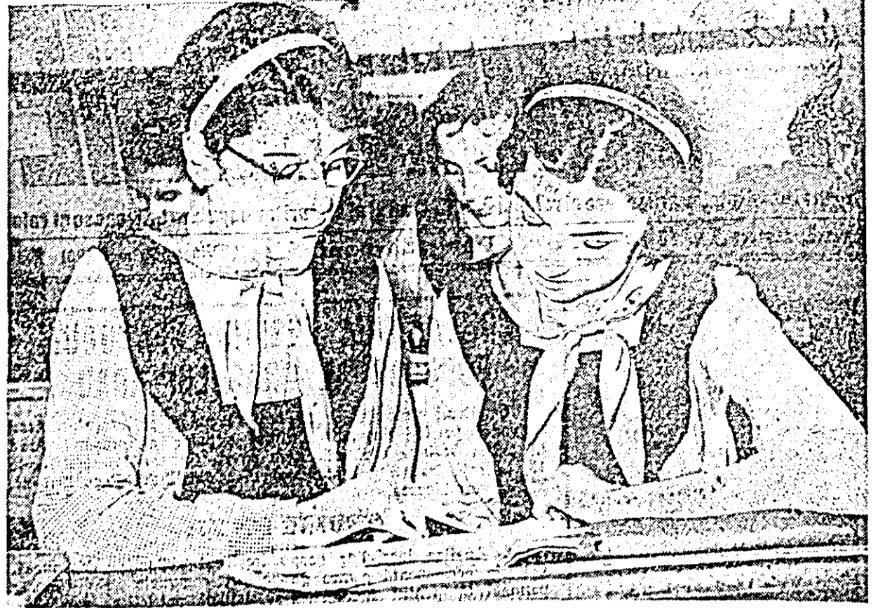
Intrajutorarea constituie, la Școala de 7 ani nr. 1, una din metodele importante de sprijinire a elevilor rămași în urmă la învățătură.