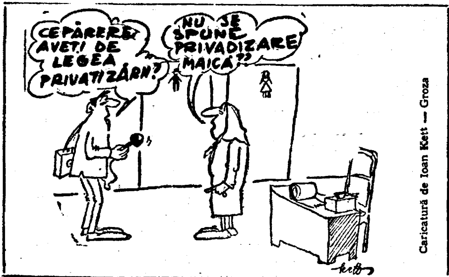
Caricatură de Ioan Kett — Groza