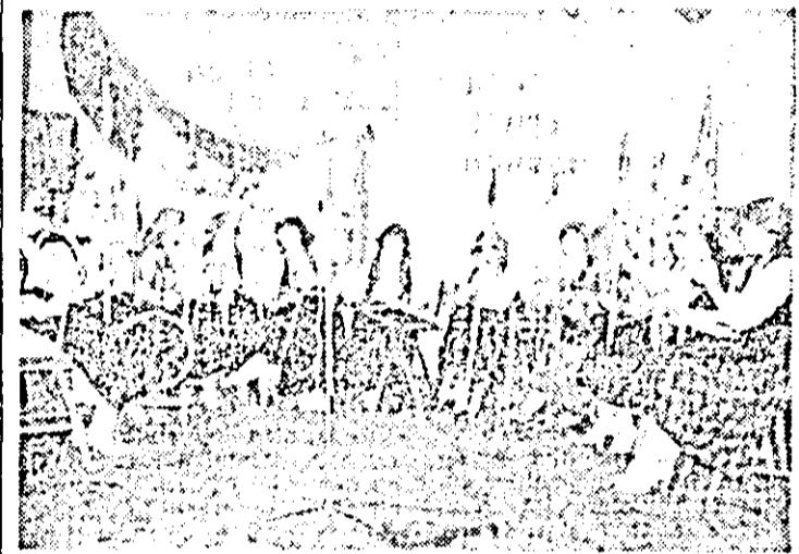
Aspect din spectacolul, laza pe C.U.A.S.C. Cermel, din cadrul Festivalului național „Cîntarea României”.

Astăzi, 12 februarie a.c., ora 17, la cinematograful „Mureșul”, publicul arădean iubitor de film are prilejul să se întâlnească cu Andrei Blaler la filmul „Prin cîmpul imperiului” (premiat la Karlovy-Vary și cu Marele premiu ACIN în 1976), iar mâine, vineri, 13 februarie a.c., la aceeași oră, va putea contempla o amplă expoziție de afișe de film ale Klarei Tamaș Blaler, afișe cu care artista plastică s-a impus printre cei mai buni creatori de grafică publicitară cinematografică pe plan internațional.