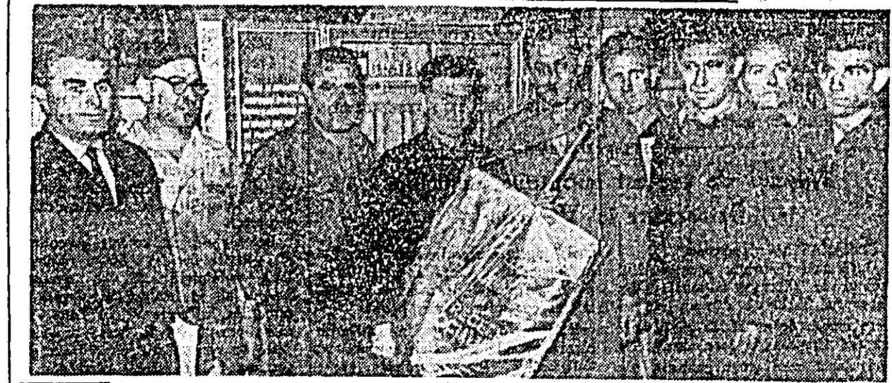
Realizînd planul producției globale în proporție de 104 la sută și obținînd economii în valoarea de 165.000 lei, colectivele secțiilor mecanic șel și turnătorie de la Uzina de strunguri au fost declarate secții evidențiate în întrecerea socialistă pe trimestrul III al anului acesta.

Noul an în învățămîntul de partid a început și în organizațiile de bază de la gospodăriile colective din Peregul Mic, Peregul Mare, Șag, Pincota, „Mureșul” Nădlac, „23 August” Curtici și altele.