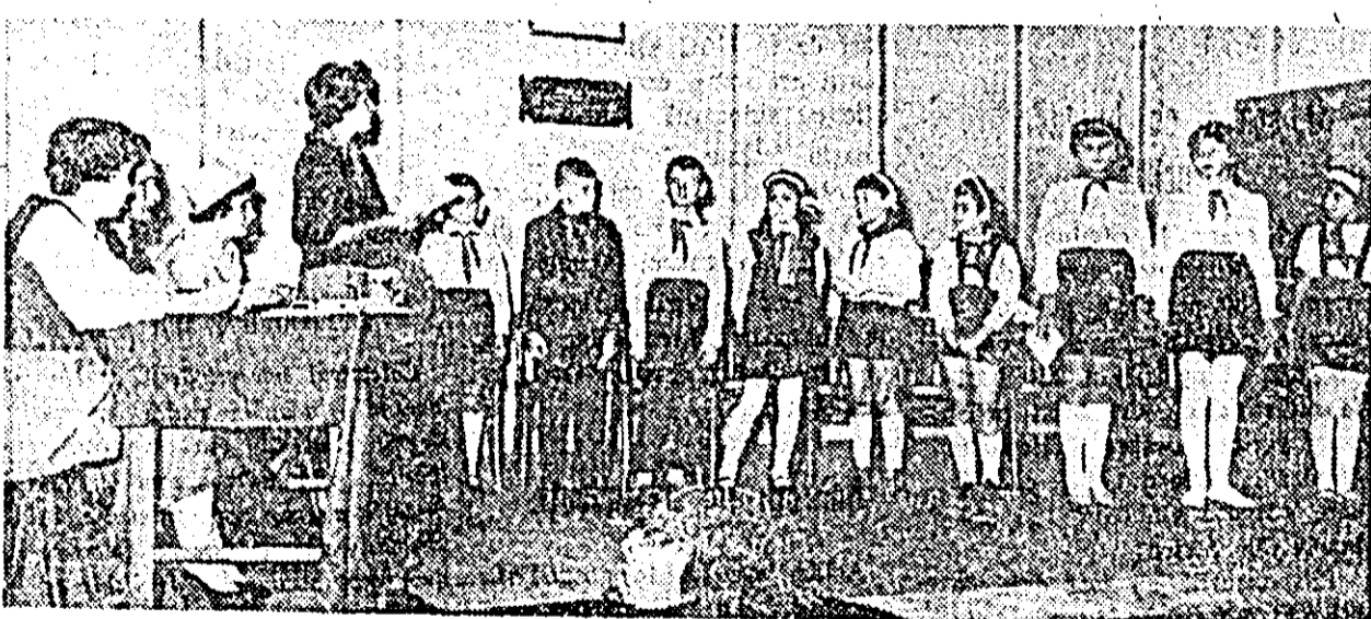
IN CLISEU: aspect din timpul concursului.