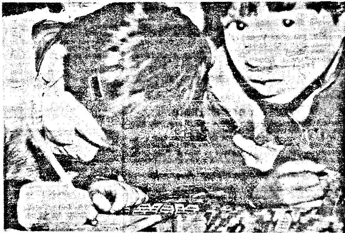
Incursiune în tainele scrisului.