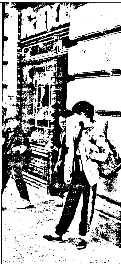
Poftele sunt mari, mai ales când e vorba de copii și de dulciuri. Dacă și posibilitățile financiare ale părinților ar fi însă pe măsura pofteilor copiilor...