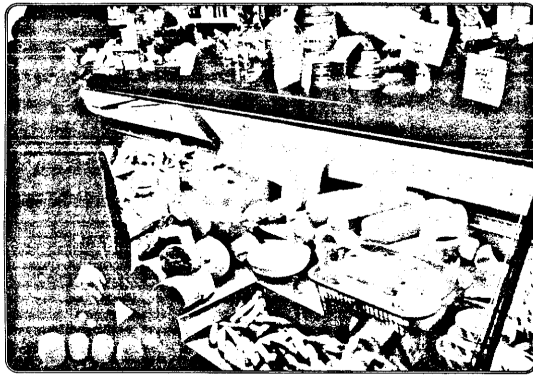
În vitrine, abundență – în buzunare bate vântul ...

„Automobile Craiova” mai informează că, până la 15 februarie 1994, produsele sale vor fi vândute la aceleași prețuri cu cele practicate după 8 decembrie 1993.