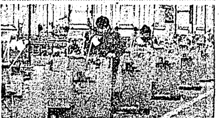
La secția strungării automate a întreprinderii de orologerie.

Lângă catafalca se afla coroana depusă din partea tovarășului Nicolae Ceaușescu.