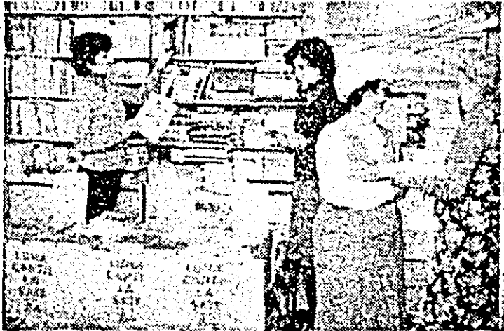
Tradiționala „Luna a cărții la sate” prilejuește și la biblioteca, din Șiria un aflus sportiv de cititori.