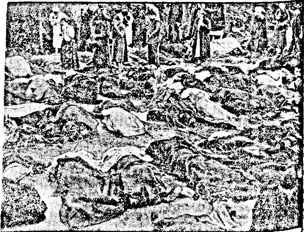
Sălbăticiunile bolșevicilor, cari au ucis m ai multe mii de oameni la Lombar

Timișoara I., Str. Solderer No. 11 Tel. 10 Sucursala IV., Bul. Berthelot No. 10