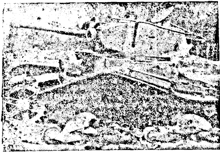
Opera granatelor germane. Un tanc bolșevic, distrus pe străzile orașului Luck.