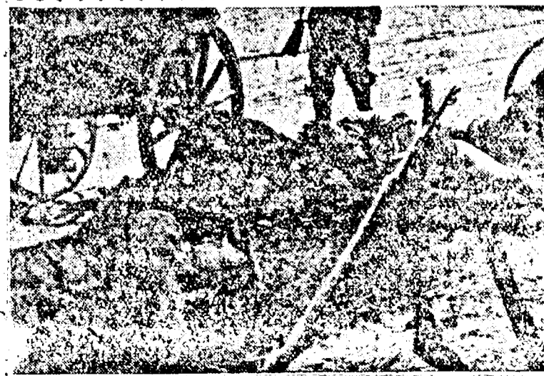
Trupele germane se odihnesc înaintea continuării marșului.

În cursul declarațiilor sale ulterioare prim ministrul a amintit că după înfrângerea Franței ministrul britanic al producției de avioane a luat asupra sa comenzile de avioane făcute de Franța în Statele Unite.