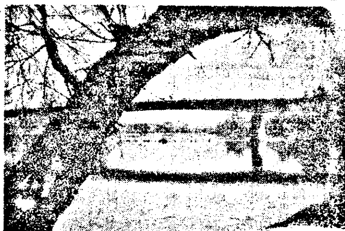
Pe Mureș, în jos...