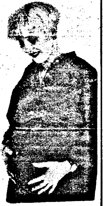
populației Europei. Conform statisticilor publicate într-un raport demografic al Consiliului Europei această situație apare în majoritatea țărilor europene și se va agrava în următorii 30 de ani.

Creșterea speranței de viață și scăderea fertilității conduc la îmbătrânirea continuă a