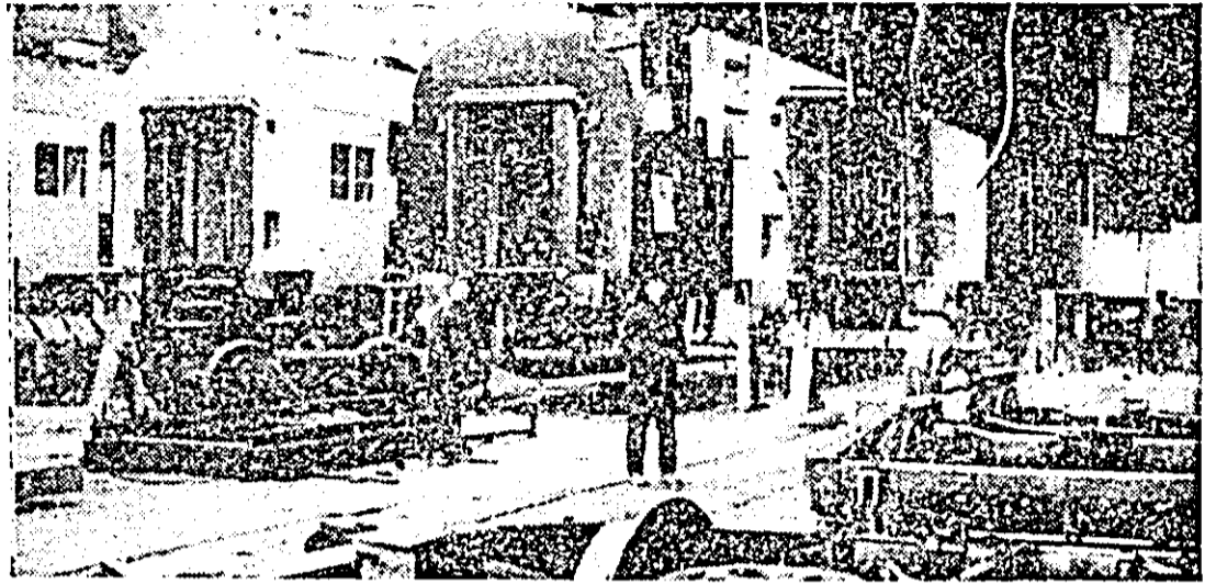
Aspect de muncă de la I.V.A. În imagine secția montaj II.

Finalizăm un cincinal, timp în care industria românească a dobîndit noi dimensiuni calitative, afirmându-se în continuare ca factor dinamizator al