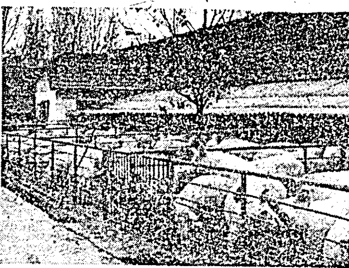
Aspect de la complexul de animale al asociației economice intercooperatiste de creștere și îngrășare a porcilor de la Mailat.