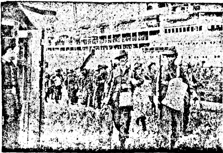
Australiensis soccer in Egipt.

Iată cum se destramă o forță a fotbalului românesc.