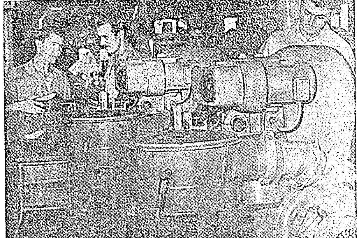
Noua maşină, cu care a fost dotată întreprinderea „Nikos Belolannis” din Timişoara, şi-au spus cuvîntul. Căitate pantofilor este din ce în ce mai bună.