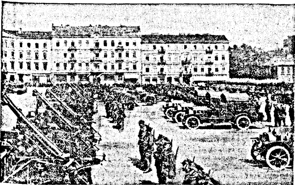
Unități motorizate poloneze înalate de a părăsi Varșovia

București, 10 (SIR). — Atât la Patriarhie cât și la toate bisericile din țară s'au oficiat azi s'au ținut religioase pentru pomenirea sufletului Patriarhului Miron cu ocazia împlinirii a sease luni dela moarte