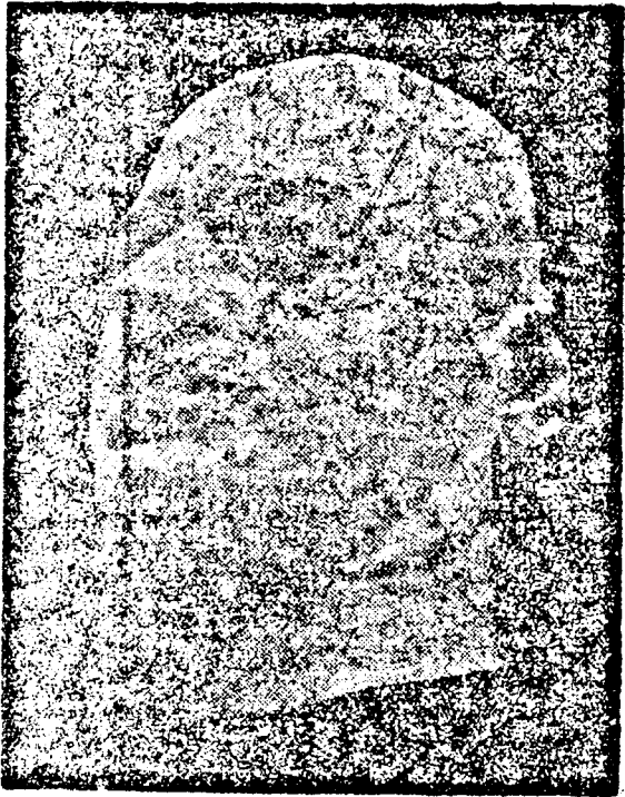
STRESEMANN HALOTTI MASZKJA.

— A német külügyminiszter ravatala mellett — mondotta a kancellár — ott áll lélekben az egész német nép, amely egyik legjobb fiát veszítette el és a világ, amely nagy államférfivel és jóakarattal emelkedett szegényebb.