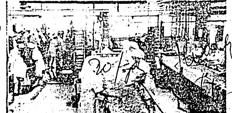
In timp ce marea majoritate a arădenilor muncesc (în cliseu aspect de la întreprinderea „Refacerea”) cinștit, contribuind la sporirea avuției noastre materiale și spirituale...