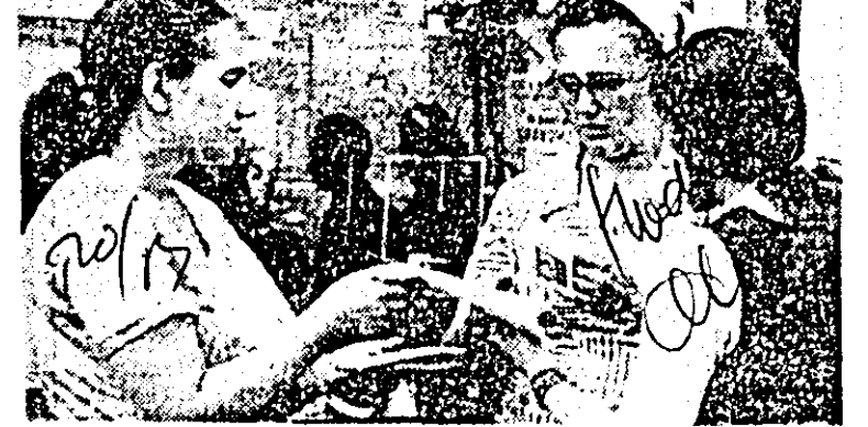
... pe strada Cernel (și nu numai aici) numeroși indivizi fac speculă, vînd și cumpără ce n-au produs niciodată.