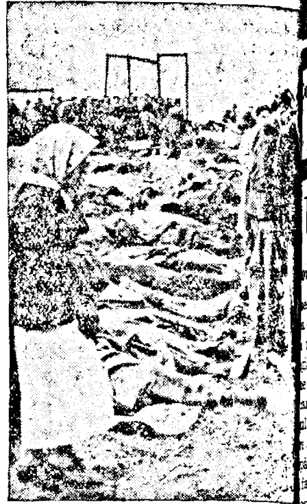
528 bărbați și femei au fost masacrați de bolșevici la Dubno

Nouile impozite nu acoperă însă, decât vreo 60 la sută din nevoi, astfel că va fi necesar ca restul de 40 la sută să fie acoperit prin împrumuturi.