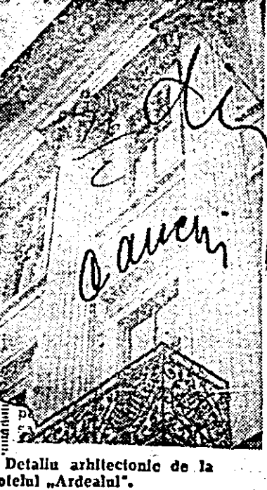
Detaliu arhitectonic de la hotelul „Ardealul”.

VERTICAL: 1. Celebru dirijor italian (1867—1957), fost director artistic la Scala din Milano, cunoscut pe toate marile podiumuri ale lumii. 2. Compozitor român contemporan, autorul poemului vocal-simfonic Horia. 3. Final de operă — Notă muzicală — Răsună trompetă! 4. Cîntăreață de operă și operetă a anilor trecuți (de Barbu) — Nalștu zellor. 5. Interval muzical care cuprinde nouă trepte — Compozitor francez (1823—1892), autorul operei Regele Ysului. 6. Particulă de refren — Liliacul, în culoarea sa obișnuită. 7. Ediție prescurtată — Petrică și... povestea muzicală de Prokofiev (neart). — Epilog la Ernani! 8. Compoziție muzicală în care două sau mai multe voci, intrînd succesiv, execută contînuu aceeași melodie. 9. Diezul, bemolul și becarul, definiți printr-un termen generic.