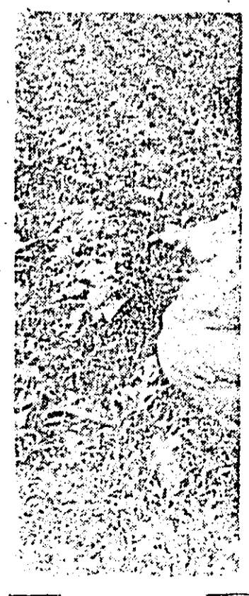
Așa arată, la Șimand, o cultură de soia sufocată de buruienii.

fel de urgență. Din păcate însă, așa cum am văzut, nu peste tot se lucrează la timp și așa cum trebuie, ceea ce înseamnă că oamenii trebuie și organizați, dar și controlați cum își fac fiecare datoria.