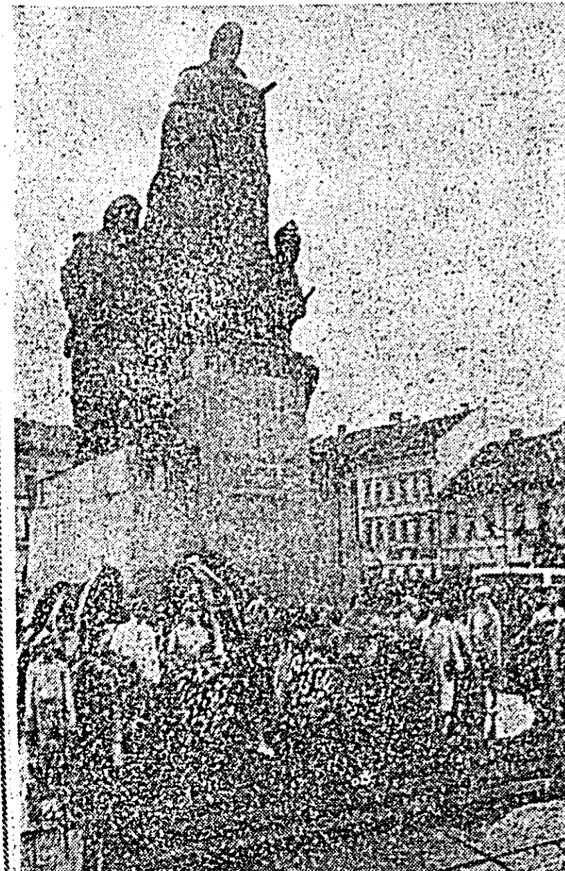
Nenumărate coroane de flori au fost depuse la Monumentul eroilor patriei.