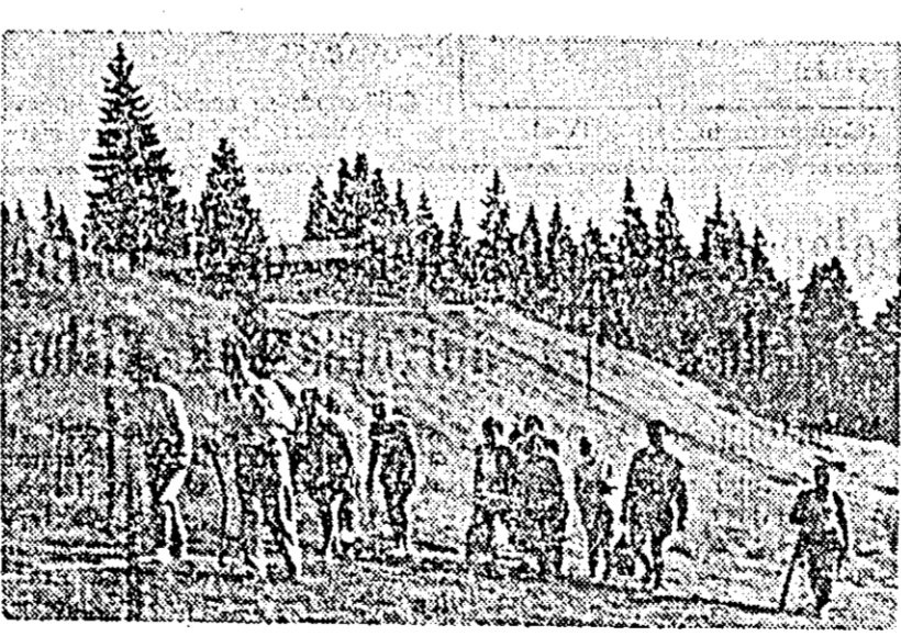
De la cota 1400, în drum spre Virful cu Dor.

„Panorama care și se deschide de aici rămînd de nouătat. Se văd munții Brașovului, Postăvarul, podul Transilvaniei, virful Bucegului...”