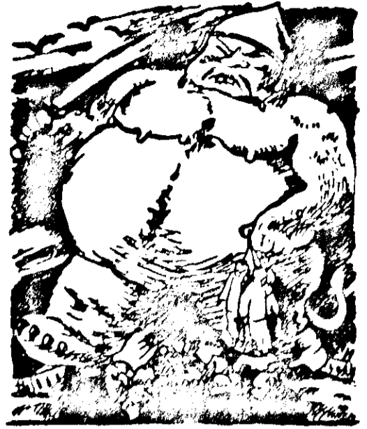
Im Osten Krieg trotz Völkerbund! Weil der wie immer auf dem Hund. Mit jedem Tage wächst die Haß. Der Gelbe hört ihn wie die Raß.