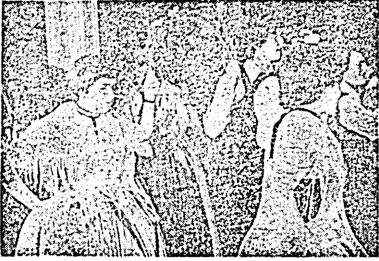
Formația căminului cultural din Zăbrani — o expresivă exponență a distinsului și suavului dans popular german local.

ziarelor „Neuer Weg”, „Neue Banater Zeitung”, și a revistei „Karpoten Rundschau”. Să mai amintim că sâmbătoarea portului popular german a mai cuprins și recitări de poezie patriotice în limba română și germană din creația unor scriitori de naționalitate germană din țara noastră, cîntece populare germane (interpretate de grupuri vocale) și românești, momente vesele etc., pentru a întregi atmosfera de căldură și delectare superioară care a fost suverană pe întreg parcursul reușitei manifestări culturale-artistice de sâmbătă seara din sala „Teba”. C. IONUȚAS