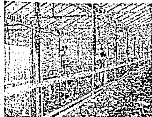
Sab epolele de sticlă ale Asociației economice cooperatiste și de stat sere Arad îngrijirea culturilor se bucură de atenția cuvenită.

Acestea sînt deci principalele obiective ale activității ce se desfășoară în aceste zile pe ogoarele județului și e necesar ca ele să fie îndeplinite întocmai, cu atât mai mult cu cît în unele unități ritmul lucrărilor este lent, ele fiind rămase în urmă fie datorită ploilor, fie slabei mobilizări a forțelor de lucru. Dar încă cum se prezintă stadiul lucrărilor de întreținere, pe baza datelor existente la Direcția agricolă județeană. Prima prașilă mecanică la sfecla de zahăr a fost executată pe 70 la sută, iar cea manuală, la aceeași cultură, pe întreaga suprafață cultivată. Cît privește prașila a doua manuală, ea s-a efectuat pe mai bine de 5300 hectare. Bine decurge lucrarea în unitățile din consiliile agro-industriale Nădlac și Vinga, care au și terminat prașila mecanică, dar sub posibilități se acționează în consiliile Aradul Nou, Pecica și Felnac, unde trebuie să se urgenteze încheierea prașilei mecanice.