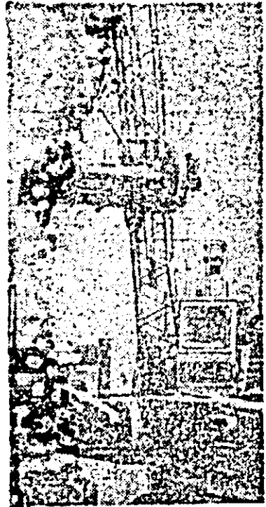
Un aspect obișnuit de muncă de la întreprinderea de vagoane: a sosit un nou lot de boghiuri pentru vagoanele de marfă.

de stat în Regatul Spaniei, la invitația regelui Juan Carlos I și a reginei Sofía, în perioada 21—25 mai 1979.