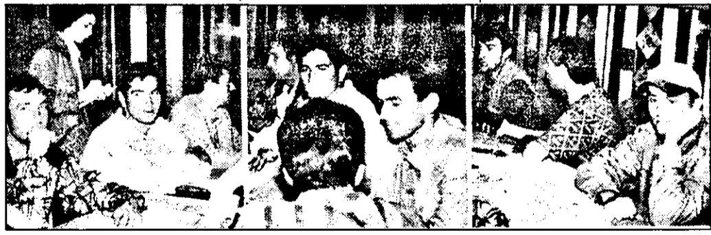
Arbitrii divizionari arădeni în vizită la „Adevărul”.