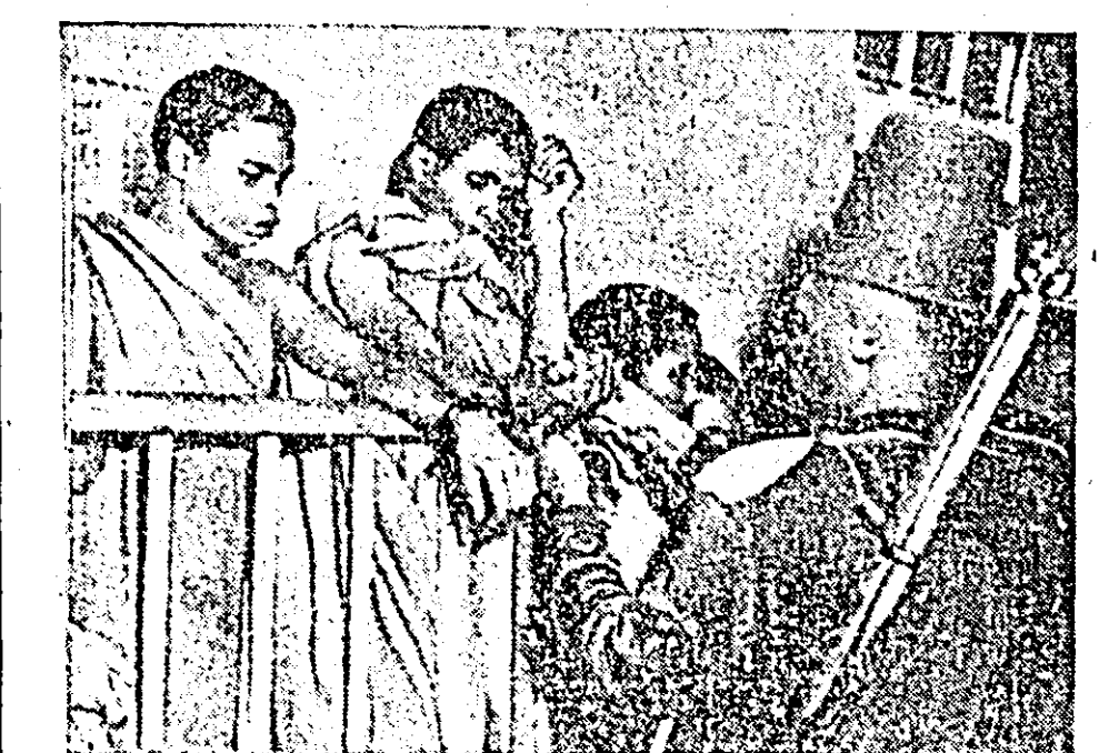
În clișeu: patrioții din Kenya așteptând sentința judecătorească

„SOLIDARITATEA” (Gai), până la 19 Dec.: „Cruceașorul Poemkin”, Repr. în zilele de lucru la orele 7 seara, Duminică repr. la orele 3, 5 și 7.