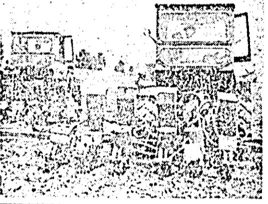
Disponind de o puternică bază materială, harnicii lucrători ai ogoarelor Ineului nu-și drămuiesc priceperea și puterea de muncă pentru a smulge pământului recolte tot mai bogate.

rarea unor condiții de pregătire tot mai bune, în anul școlar trecut au fost date în folosință un internat cu o capacitate de 210 locuri, o cantină școlară și un nou sediu al casei pionierilor și șoimilor patriei. Orașul Ineul dispune de o bogată rețea comercială, care asigură pentru anul 1979 o desfacere de măruri de peste 133 milioane lei, cu 11 la sută mai mult decît în anul precedent, iar valoarea prestațiilor de servicii către populație depășește 32 milioane lei. Ineul are astăzi și o bogată rețea sanitară, cu aparatură medicală complexă și modernă, cadre bine pregătite ce veghează neîncetat la sănătatea oamenilor muncii de aici.