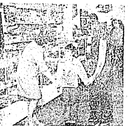
Pentru satisfacerea necesităților de consum cu produse alimentare și bunuri de larg consum, populația orașului are la dispoziție o largă rețea de magazine comerciale, bine aprovizionate. Iată o secvență colidantă din magazinul pentru copii „Gulliver”.

Să mai amintim universitatea cultural-științifică, deselexpoziții și spectacole găzduite de ineani, faptul că orașul mai dispune de o bibliotecă centrală cu peste 39 000 volume, o bibliotecă școlară și două de tip rural, două săli de spectacole, trei de proiecții, cinematografe, terenuri de sport —, pentru a avea imaginea vieții spirituale de azi a Ineului, al cărei puls se accelerează pe măsura transformărilor profunde ale vieții noastre noi.