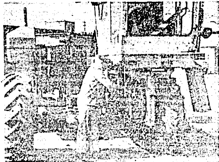
La S.M.A. Felnac se acționează de zor la pregătirea utilajelor necesare în campania de toamnă.