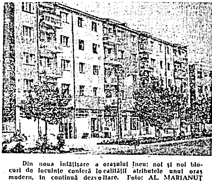
Din noua înfățișare a orașului Ieneu: noi și noi blocuri de locuințe conferă localității atribuțiile unui oraș modern, în continuă dezvoltare.

ta la întreprinderea prelucrătoare. De asemenea, cum ne informa tovarășul Ion Mirolu, președintele consiliului unic, cooperatorii din Sîntana și Comăuș au început pe 15 la și strînsul cartofilor după ce șase mașini le-au distilcat din sol. Lucrările care s-au întetit în aceste zile, demonstrează că pe ogoare activitatea este îndreptată spre recoltatul culturilor de toamnă și pregătirea producției viitoare, acțiunii ample la care se cer antrenate toate forțele satelor.