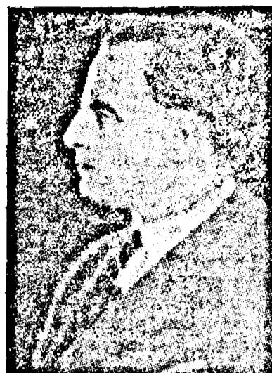
D. GHELMEGEANU ministrul Internelor

Articolul a produs o profundă impresie în toate cercurile și în opinia publică turcă.