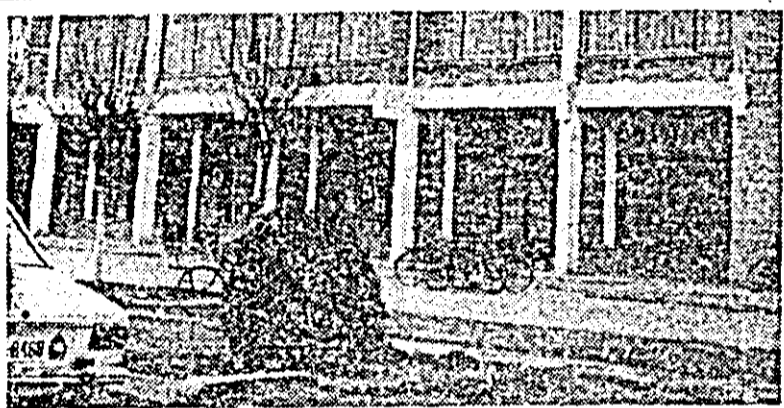
Noul complex de deservire a populației din Nădlac.