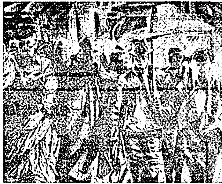
„Construim cu ferestrele spre soare” grafică de LUCIAN COCIUDA