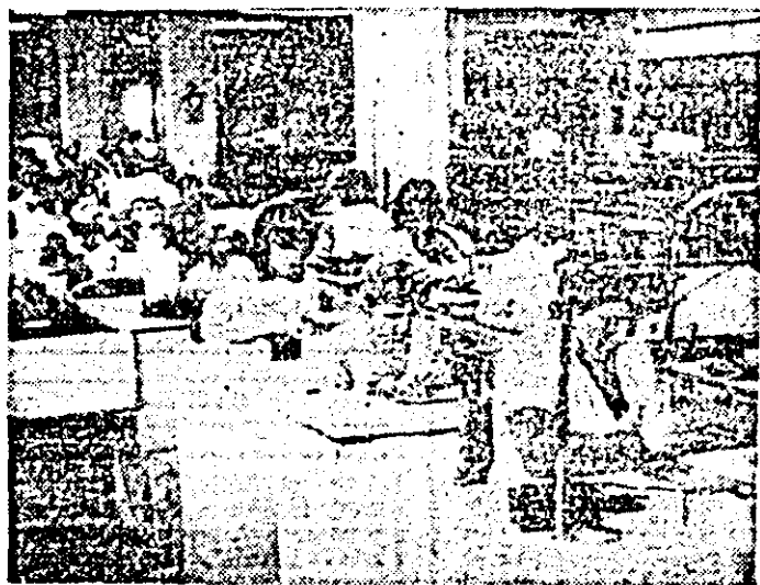
Aspect de muncă în secția montaj a întreprinderii de ceasuri „Victoria”.

Situndu în centrul preocupărilor realizarea exemplară a producției fizice planificate și cu precădere a producției de export, punînd un accent deosebit pe perfecționarea organizării muncii și folosirea intensivă a mașinilor și utilajelor din dotare, colectivul muncitoresc de la Fabrica de strunguri din Lipova a obținut, în perioada trecută de la începutul anului, o serie de semnificative realizări în activitatea productivă. În rîndul acestora se numără, între altele, realizarea suplimentară, față de sarcinile de plan la zi, a cinci strunguri. Totodată, în acest context, mai remarcăm faptul că pînă acum au fost livrate la export 30 de strunguri.