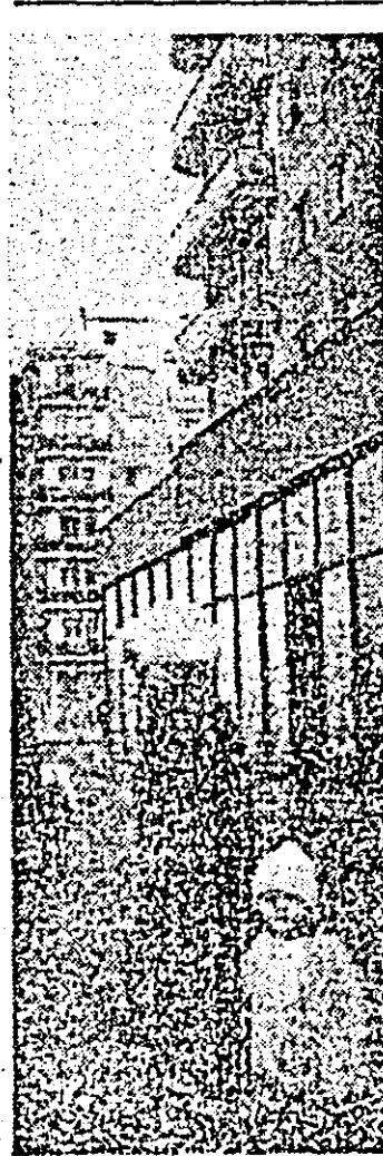
Aspect cotidian din cartierul arădean Micălaca.

Un nou obiectiv în constelația economiei arădene. Un obiectiv merit să valorifice tot mai înalt resursele județului, să satisfacă în măsură crescîndă nevoile populației. O fabrică la construirea căreia constructorii și montorii au pus mult suflet. Dovadă, aprecierea beneficiarului care, de-a dreptul îi onorează.