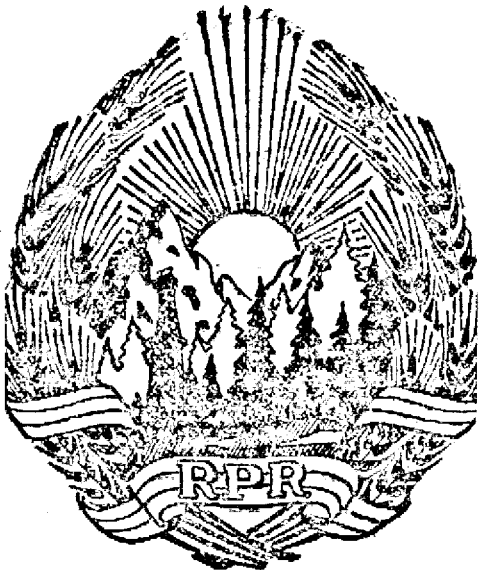
STEMA R. P. R.

principiilor democratice de conviețuire frățească și de a muncii și lupta în comun pentru consolidarea Republicii Populare Române, patria noastră.