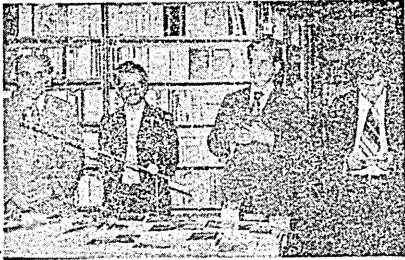
Aspect de la bibliotecă „Ioan Slavici”, unde vineri a avut loc lansarea volumului „Pietrele” de Gh. Schwartz.