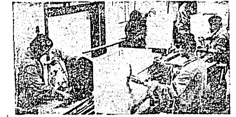
Aspect din atelierul microîntreprinderii liceului.