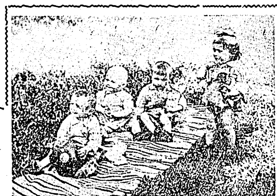
În clipșun aspect de la creșta fabricii „7 Noiembrie”.

de dorit, acrisirea de asemenea. Hălele personalului de la bucatărie sînt într-o situație nepermisă. Toate acestea se încearcă a se justifica prin lipsa de personal.