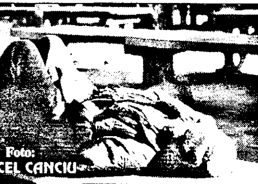
Piața Pompierilor, după ultima „beție” a mutărilor, s-a transformat în cel mai ieftin hotel. Pe gratis!

este faptul că piața ecologică nu era supraaglomerată și, deci, fără probleme putea oricine să-și desfășoare marfa aici. Însă pentru aceasta aveai nevoie de abonament. Ca la tramvai. E tot ideea conducerii S.C. T.O.P. S.A.! Să nu vină în piață și să vândă cei care n-au trecut pe la „birouri” pentru