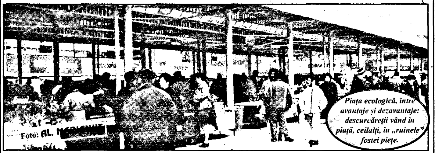
Piața ecologică, între avantaje și dezavantaje: descurcările vând în piață, ceilalți, în „ruinele” fostei piețe.

„eroic” pentru fiecare centimetru de masă. Cei mai liniștiți sunt comercianții din piețele agroalimentare. Ceilalți nu cedează nici în ruptul capului pentru ca și alții să-și vândă marfa alături de ei. SORIN GHILEA (Continuare în pagina a 3-a)