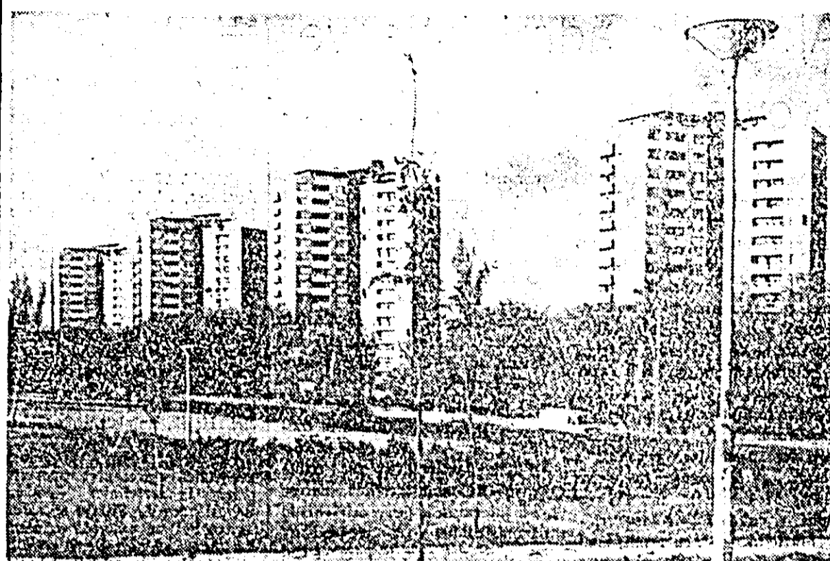
Cartier de locuințe noi construite la marginea Belgradului