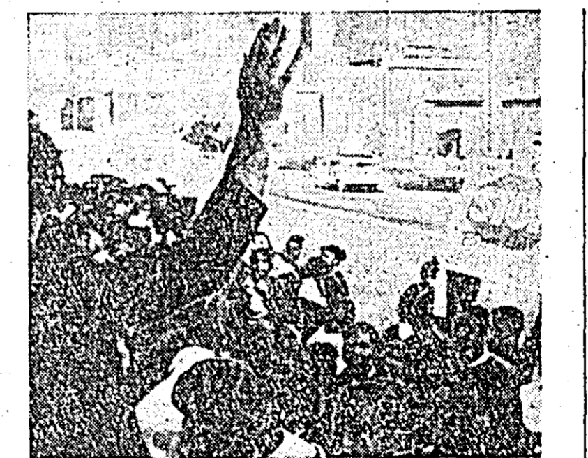
SUA: În statul Wisconsin în orașul Milwaukee studenții de culoare, împreună cu profesorii lor au demonstrat împotriva segregăției rasiale din școli.

von Hassel) urmărea, totodată, să obțină sprijinul Angliei pentru tendința RFG de a avea acces spre arma nucleară. Nu l-a obținut. Britanicii se mențin — și se pare că o fac cu mai puțin entuziasm decît înainte — la propunerea lor anterioară privitoare la forța atlantică, care nu satisface exigențele Bonnului (preferința vest-germanilor îndreptîndu-se spre proiectul american al forței nucleare multilaterale). Accastă dispută va constitui obiectul reuniunii ministrilor apărării ai unor țări NATO, care a început sîmbătă la Paris. Eforturile RFG vor fi reinvoite cu acest prilej, dar agenția France Presse consideră că ministrul nu vor fi în măsură să satisfacă cererile vest-germane. De altfel, cinci țări sînt absente — între ele și Franța — reuniunea constituînd un nou episod al divergențelor dintre partenerii atlantici. „Războiul de guerilă” interoccidental este în plină desfășurare. Calendarul activității diplomatice occidentale pentru viitorul apropiat este încărcat. Vor exista deci noi prilejuri de a urmări evoluția conflictului. N. RATES