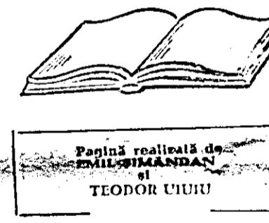
Pageină realizată de EMIL SIMĂNDAN și TEODOR UURU