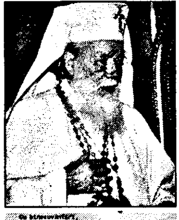
TEOCTIST PĂRINTELE BISERICII ORTODOXE ROMÂNE

Ieri ne-a sosit la redacție o scrisoare din partea Patriarhului României. Preafericitul Părinte Teoctist, Patriarhul Bisericii Ortodoxe Române adresează conducerii ziarului „Adevărul” o felicitare pentru profesionalismul cu care cotidianul nostru a tratat vizita în Arad a Preafericitului Sale și hirotonirea întâiului episcop al românilor ortodocși din Ungaria. În scrisoare, printre alte aprecieri, se spune: