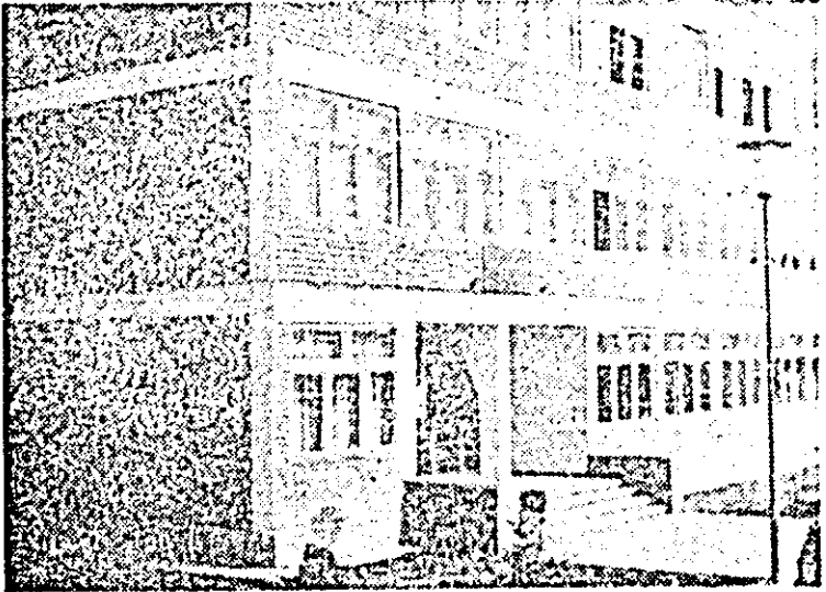
Aspect exterior al Liceului Industrial nr. 7 de construcții.