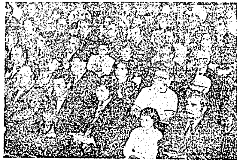
Aspect din sală în timpul adunării.