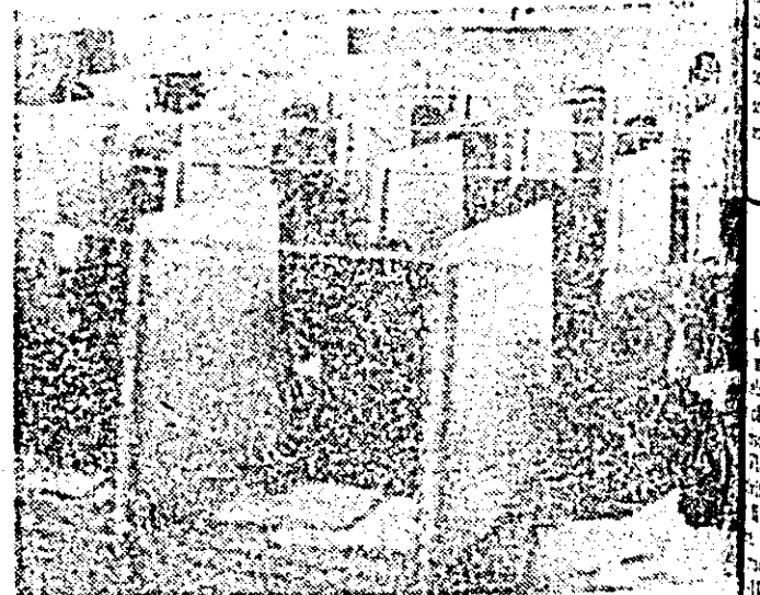
Aspect din modernul laborator fizic al Liceului Industrial nr. 7, cu profil de construcții.