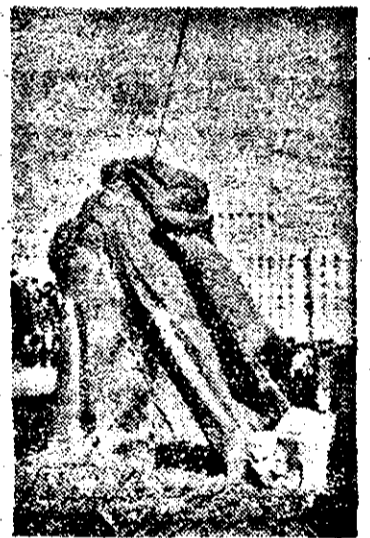
Tonele de metal coborite de pe soclu poate își vor găsi o utilizare artistică.