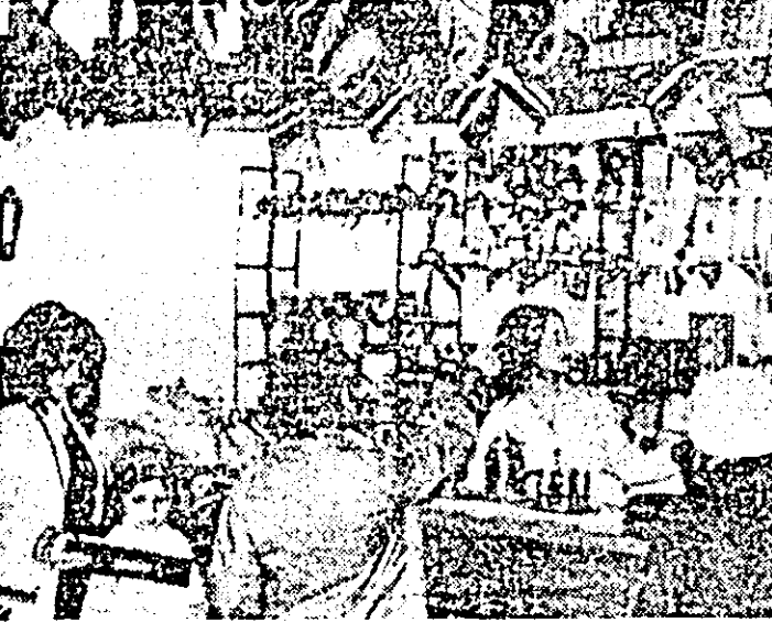
Cooperativa „Arta meșteșugarilor” este preocupată de a crea obiecte de un deosebit interes și care păstrează specificul local. În imagine, aspect de la magazinul „Venus”, saloan de artizanat, unde sunt expuse produsele cooperativii.

Sub genericul „17 ani de la Congresul al IX-lea al P.C.R.: Despre viața noastră noi însuși”, astăzi, miercuri, 14 Iulie a.c. în cadrul emisiunii „De la 1 la 3”, difuzată pe programul 1 al posturilor centrale de radio, va avea loc o transmisie directă din Arad, realizată cu concursul redactorilor de la studioul teritorial de radio și televiziune Timișoara. Locuitorii județului nostru și din întreaga țară vor face cunoștință cu oameni și fapte, cu realizări deosebite obținute în cei 17 ani care au trecut de la Congresul al IX-lea al partidului. Pe canalul de televiziune va fi publicată o emisiune în mijlocul oamenilor muncii de la I.V.A., schela de extracție Zădăreni, la Pecica, Siutana, Chișineu Criș, Buteni etc. și vor putea auzi un bogal program de muzică corală, ușoară și populară.