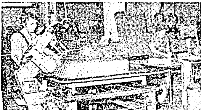
Tapiteria, executată cu mașini și utilaje moderne, ocupă o importantă pondere în producția combinatului și se bucură de aprecieri deosebite.

Drumul parcurs de combinatul arădean de mobilă nu este un drum specific, un drum aparte. El este drumul întregii economii românești, este drumul inaugurat de Congresul al IX-lea al partidului — al dezvoltării socialiste, al modernizării și eficienței.