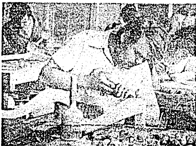
Sculptura „arta” care se practică în 1981 de către cei care, extinsa la scară industrială, a adus arădenilor plăcerea beneficiarilor din numeroase țări.