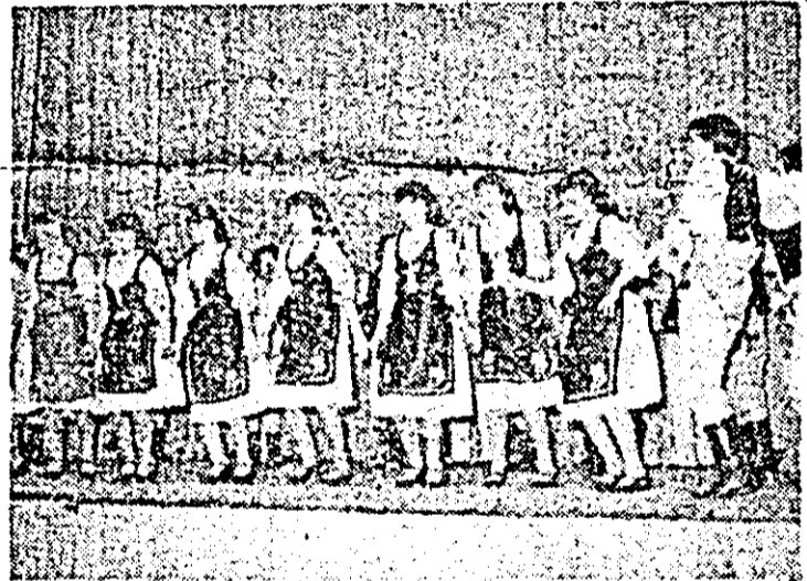
Pe scena festivalului muncii și creației libere, formația de dansuri populare a căminului cultural din Pecica.

unor propagandiști bine pregătiți, bine documentați. S-a recomandat, drept remediul, antrenarea în mai mare măsură a tuturor cadrelor didactice, a altor categorii de intelectuali din oraș la această activitate. Mai mult, în fața instituțiilor de cultură orașenești, a organizațiilor de tineret și femei, a celor sindicale, O.D.U.S. s-a formulat exigența generalizării sărbătoririi nașterilor copiilor, a majoratului, a căsătoririlor, pensionărilor, aniversărilor personale. Casa de cultură și-a propus și ea în planurile sale de muncă introducerea în repertoriul formațiilor artistice a unor acțiuni cu conținut ateist, precum și bibliotecă sau cinematograful. Și probabil că, în urma unei temeinice, sistematice și continue activități pe acest lărm, rezultatele să fie și mai bune și mai eficiente.