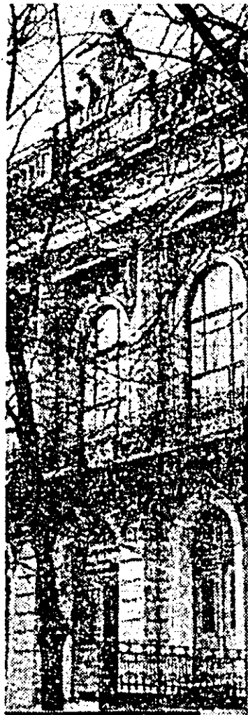
Ilustrată arădeană.