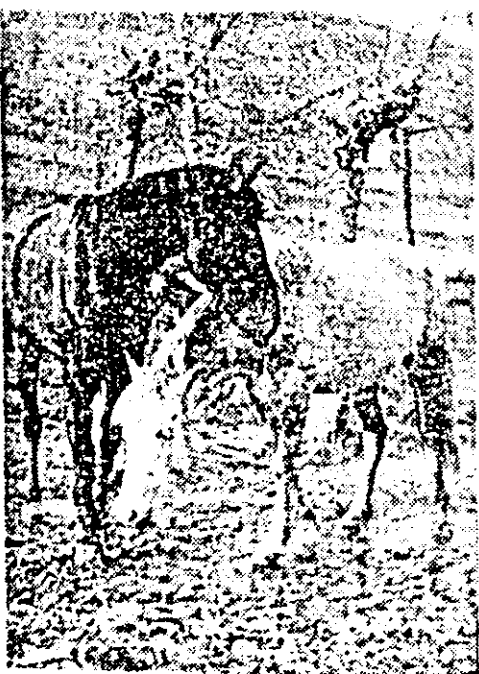
Alb și negru.