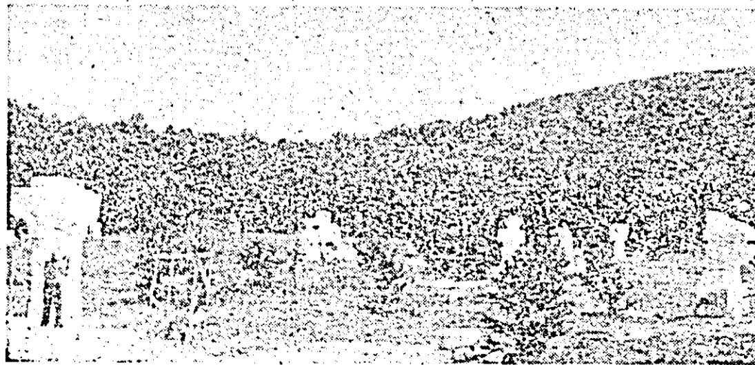
Imagine parțială din timpul desfășurării celei de a treia ediții a Simpozionului național de sculptură de la Căsoaia.