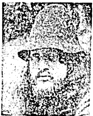
IOAN PÂRVAN, sculptor din București, născut în anul 1950 la Bistreț (Dolj).