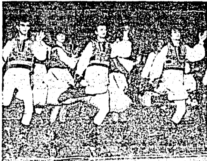
În lăureșul jocului popular, pe scenă marelui Festival național „Cîntarea României”.

IOSIF MUNTEANU, Cenaclul literar „Lucațarul”